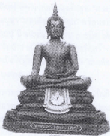
หน้าตัก ๕ นิ้ว