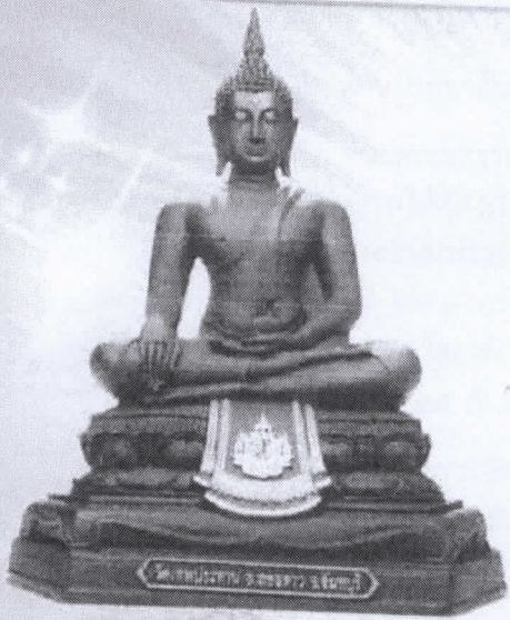
หน้าตัก ๙ นิ้ว

เพื่อน้อมเกล้าฯ ถวายเป็นพระราชกุศลแด่ พระบาทสมเด็จพระบรมชนกาธิเบศร มหาภูมิพลอดุลยเดชมหาราช บรมนาถบพิตร เนื่องในโอกาสพระราชพิธีมหามงคลเฉลิมพระชนมพรรษา ครบ ๗ รอบ ๕ ธันวาคม ๒๕๕๔