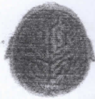
จินตลักษณ์