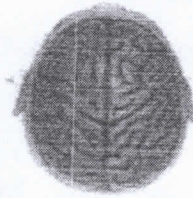
จินตปัญญา