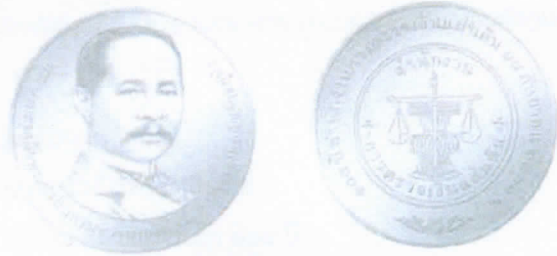
ชนิดเหรียญเงิน ประเภทธรรมดา ขนาดเส้นผ่านศูนย์กลาง 30 มิลลิเมตร

สำนักงานการตรวจเงินแผ่นดินจัดทำเหรียญที่ระลึก เนื่องในโอกาสครบรอบ ๑๐๘ ปี แห่งการสถาปนาสำนักงานการตรวจเงินแผ่นดิน เพื่อน้อมรำลึกในพระมหากรุณาธิคุณพระบาทสมเด็จพระจุลจอมเกล้าเจ้าอยู่หัว พระบิดาแห่งการตรวจเงินแผ่นดินไทย