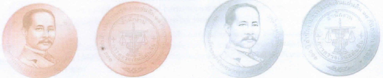
ชนิดเหรียญทองแดง ประเภทธรรมดา ขนาดเส้นผ่านศูนย์กลาง 30 มิลลิเมตร