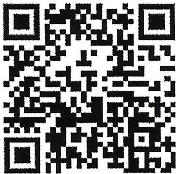
เอกสารประกอบการเรียน