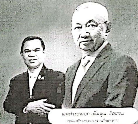
พลตำรวจเอก เป็นพูน จิตชวน รัฐมนตรีว่าการกระทรวงศึกษาธิการ

พร้อมรับโล่และเกียรติบัตร สำหรับรางวัลอื่น ๆ จะได้รับเกียรติบัตร