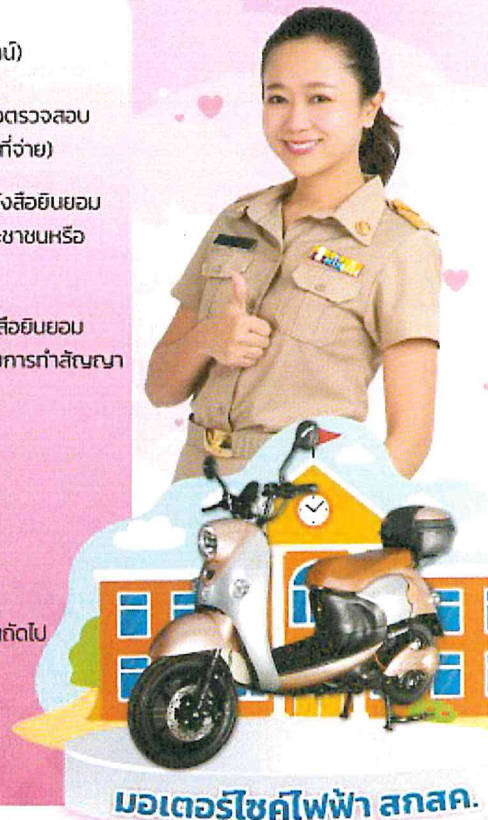
มอเตอร์ไซค์ไฟฟ้า สกสค.

5. รับรถ ที่สำนักงาน สกสค. จังหวัดพร้อมทำสัญญาสิ้นเชื่อรถจักรยานยนต์ไฟฟ้า