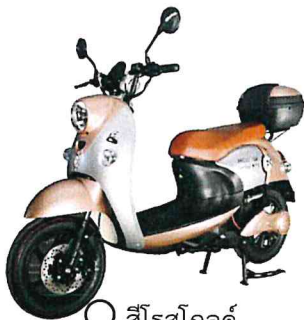
○ สีโรสโกลด์